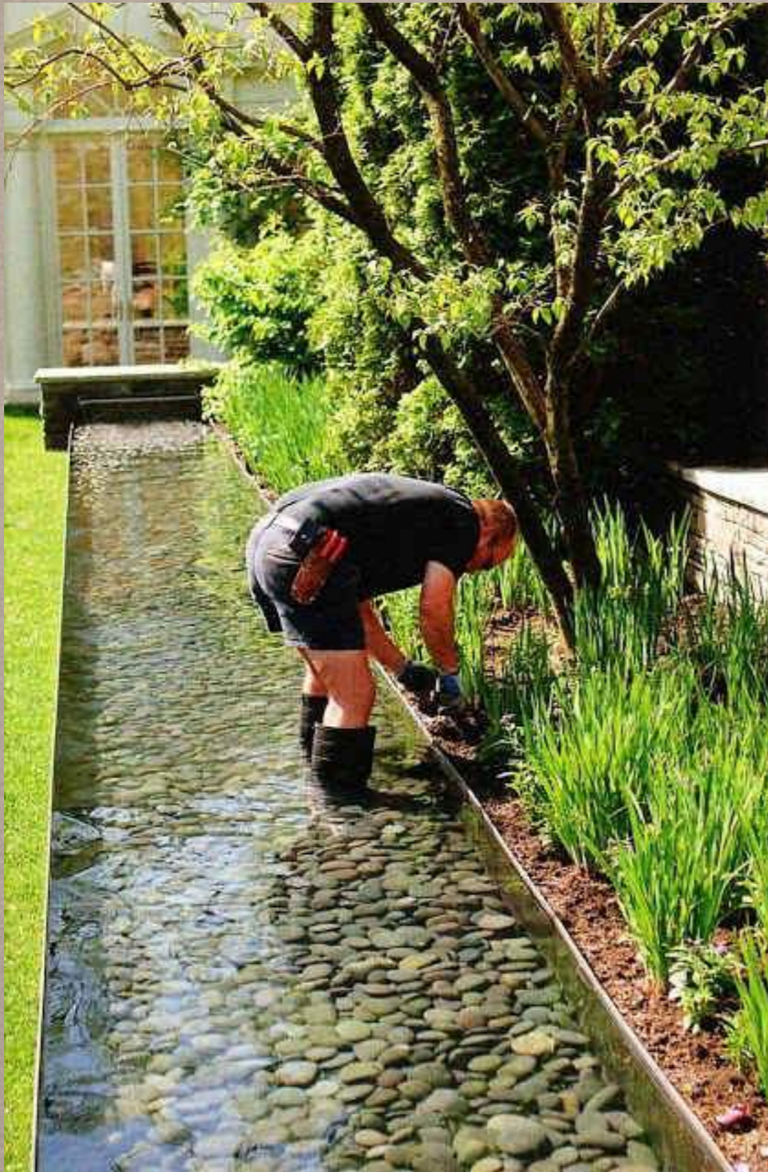
un lugar para cuidar las semillas