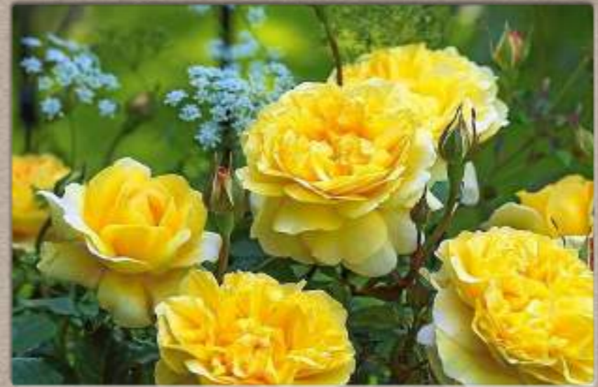
un lugar para cuidar los sueños