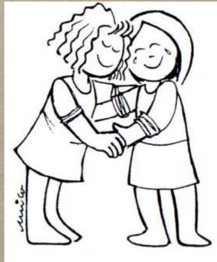
un lugar para cuidar la amistad